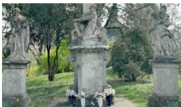
A képen az érsekújvári kálvária egy részét látni.