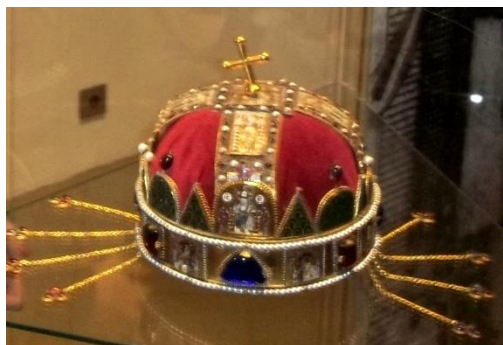
a magyar királyi korona másolata

2.* Az Oszmán Birodalom közép-európai terjeszkedésével összefüggésben Pozsony rendkívül fontos pozícióra tett szert, amely még Magyarország törökök általi közvetlen fenyegetettségének megszűnése után is sokáig fennmaradt. A válaszlapon egészítsd ki a hiányzó adatokat.