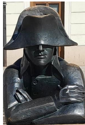
Napóleon katonájának a szobra Pozsonyban

15. Az alábbi négy lehetőség közül válaszd ki az egy helyes megoldást és írd a válaszlapra.