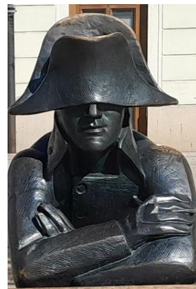
socha napoleonského vojaka v Bratislave