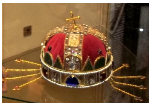
kópia uhorskej kráľovskej koruny

Bratislava sa stala ... A ... mestom a zároveň korunovačným mestom Uhorska. Korunovačné klenoty boli uložené v priestoroch veže Bratislavského ... B ... . Samotná korunovácia prebiehala v ... C ... sv. Martina, ako prvého tu korunovali ... D ... za uhorského panovníka. V Bratislave zasadal aj uhorský snem, a to až do roku ... E ... .