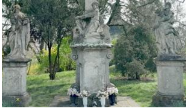
Na obrázku vidíte časť kalvárie v Nových Zámkoch.

8.* Zistite, či sú nasledujúce tvrdenia o Novej pevnosti v Nových Zámkoch pravdivé alebo nepravdivé. V odpovedovom hárku zakrúžkujte iba správnu možnosť áno alebo nie .