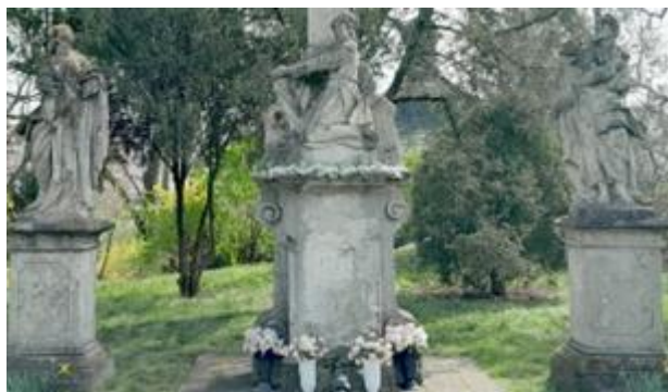
A képen az érsekújvári kálvária egy részét látni.