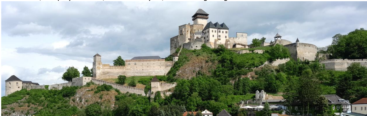
A képen látható a vár, amely az említett uralkodó születési helye volt

7.* Sorold a három Habsburg-ellenes/rendi felkelés vezetőivel kapcsolatos információkat a válaszlapon található névhez. Írd a válaszlapra a helyes válasz betűjelét.