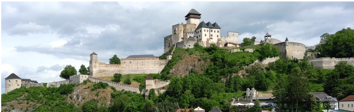
Na obrázku vidíte hrad, ktorý bol rodovým sídlom spomínaného panovníka.

7.* Uvedené informácie týkajúce sa vodcov troch protihabsburských/stavovských povstaní priradte v odpovedovom hárku k správnejmu menu. Stačí zapísať písmená označujúce správne voľby.