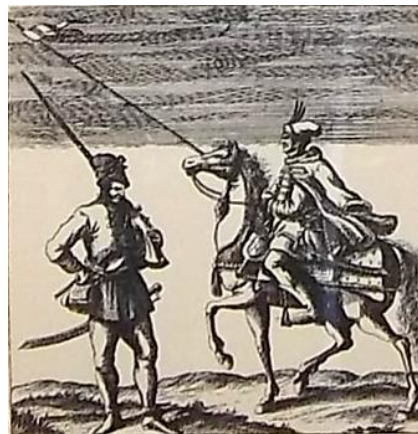
Na obrázku je husár aj hajduk.