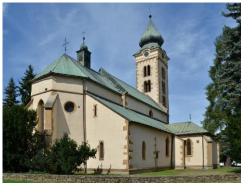
Kostol sv. Mikuláša v Liptovskom Mikuláši

18. Vyberte vždy iba jednu správnu odpoveď zo štyroch možností a zapíšte ju do odpovedového hárka.