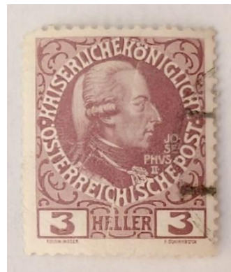
Jozef II. na známke z roku 1908

10. V odpovedovom hárku doplňte správne názvy významných vedeckých prác a priezviská ich autorov, slovenských vzdelancov 18. storočia. Pomôžte si iniciálami krstného mena/mien aj miestom, kde sa narodili.