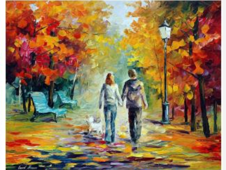
Леонид Афремов «Прогулка в осеннем парке»