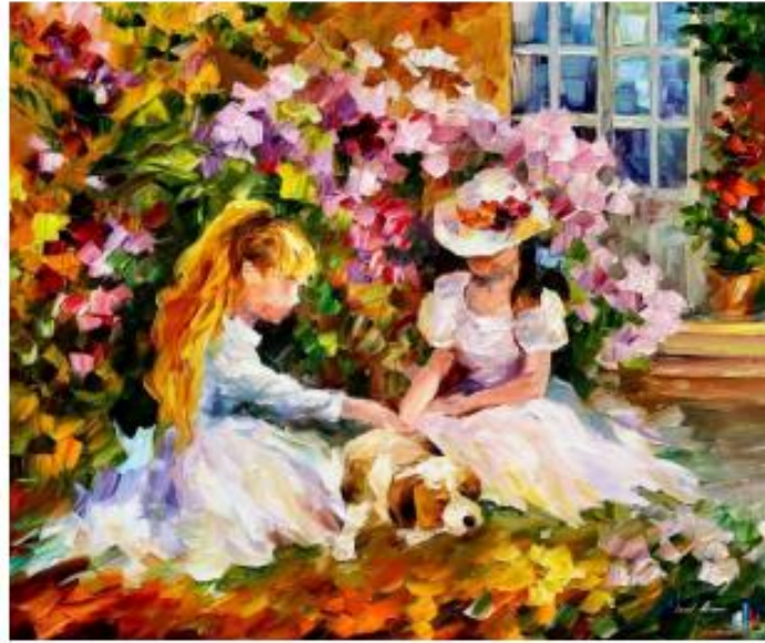
Леонид Афремов «Девочки с собакой»