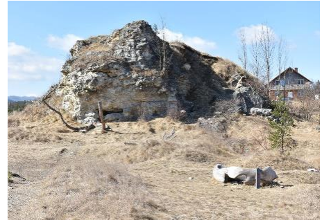
A gánóci régészeti lelőhely

17. Írd a válaszlapra, melyik korszakok voltak a későbbiek az ember társadalmi fejlődésében. Elegendő, ha leírod a helyes betű- és számkombinációt.