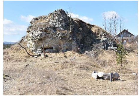
Archeologická lokalita v Gánovciach

17. Do odpoveďového hárka zapíšte, ktoré z nasledujúcich období vývoja ľudskej spoločnosti boli neskôr . Stačí, aby ste napísali správnu kombináciu písmena a čísla.