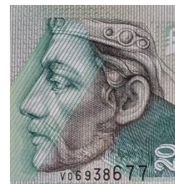
Pribina a 20 Sk bankjegyen