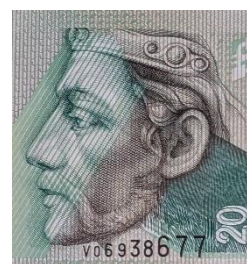
Pribina na 20 Sk bankovke