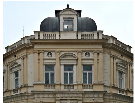
A Grössling épületének homlokzata