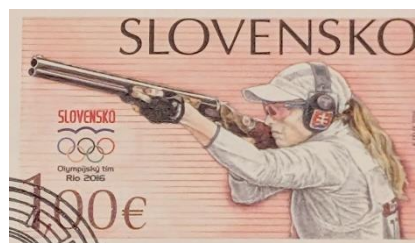
Danka Barteková na známke k OH 2016