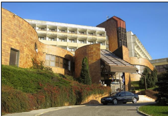
Centrum účelových zariadení – SÚZA