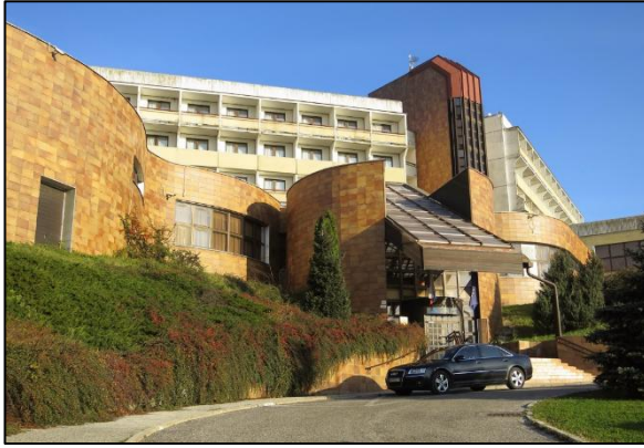
Centrum účelových zariadení – SÚZA