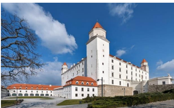
Bratislavský hrad z juhozápadu