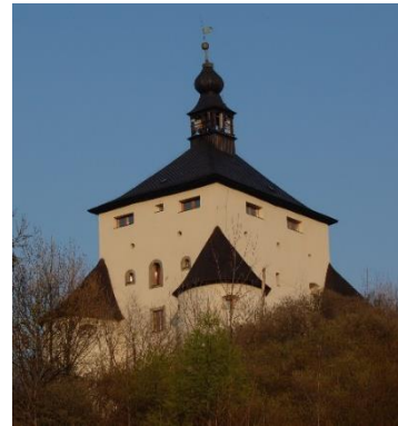
Na obrázku je Nový zámok v Banskej Štiavnici.

13. V súvislosti s osobnosťou M. R. Štefánika rozhodnite, či sú nasledujúce tvrdenia pravdivé alebo nepravdivé. V odpovedovom hárku zakrúžkujte iba možnosť áno alebo nie.