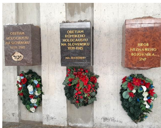
Na obrázku je časť pamätníka SNP v Banskej Bystrici.

19. Do odpovedového hárka správne zapíšte odpovede na nasledujúce otázky.