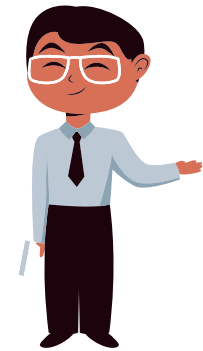
Riaditeľ školy/ školského zariadenia

Krok č. 2 - Riaditeľ určí vypracovaním vyjadrenia na účel poskytnutia podporného opatrenia pedagogického zamestnanca alebo odborného zamestnanca školy alebo školského zariadenia v zmysle § 145b ods. 1 písmeno a) a písmeno b, ktoré obsahuje návrh podporného opatrenia a rozsah. Vyjadrenie následne riaditeľ pošle žiadateľovi (a tiež zákonnému zástupcovi, ak ide o rozličné osoby).