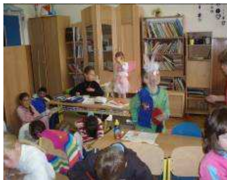
Tu sme my ako objavujeme 7divov Slovenska